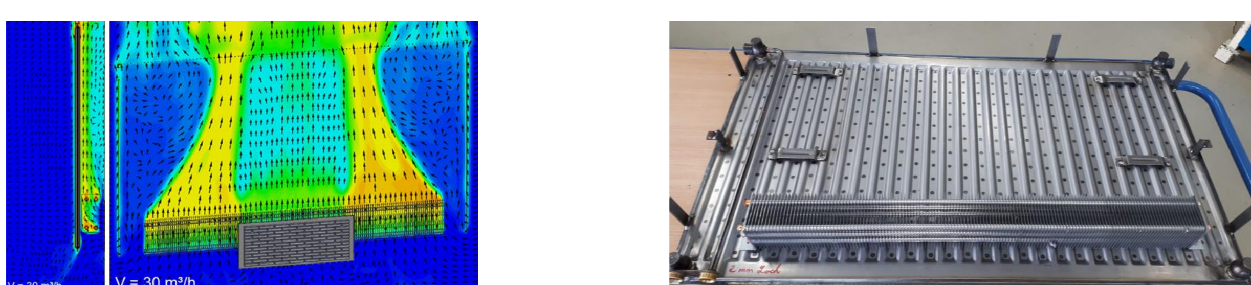
Temperaturverlauf im Heizkörpermodell mit Zuluft (links); Funktionsmuster, Rückseite der Heizfläche (rechts)

KERMI GmbH entwickelt angepasste Niedertemperatur-Heizflächen, für die Heizung, Kühlung und Belüftung von Räumen, welche sich optimal mit Lüftungsanlagen kombinieren lassen.