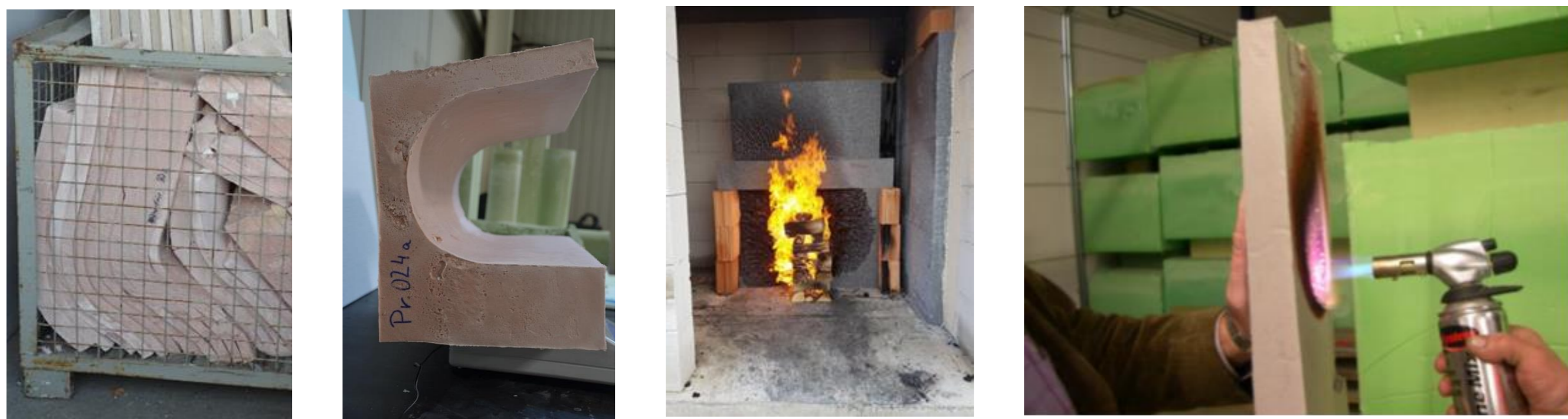
Verformungen im Langzeittest, Baumuster Rollladenkasten, Brandtest (v.l.n.r.)

Beck+Heun GmbH entwickelt unter Verwendung von Wasserglas basierten Rohstoffen gieß- und schäumbare mineralische Dämmstoffe für die Verwendung in der Fassade. Unterschiedliche Materialkompositionen und Verarbeitungsmethoden werden entwickelt und überprüft.