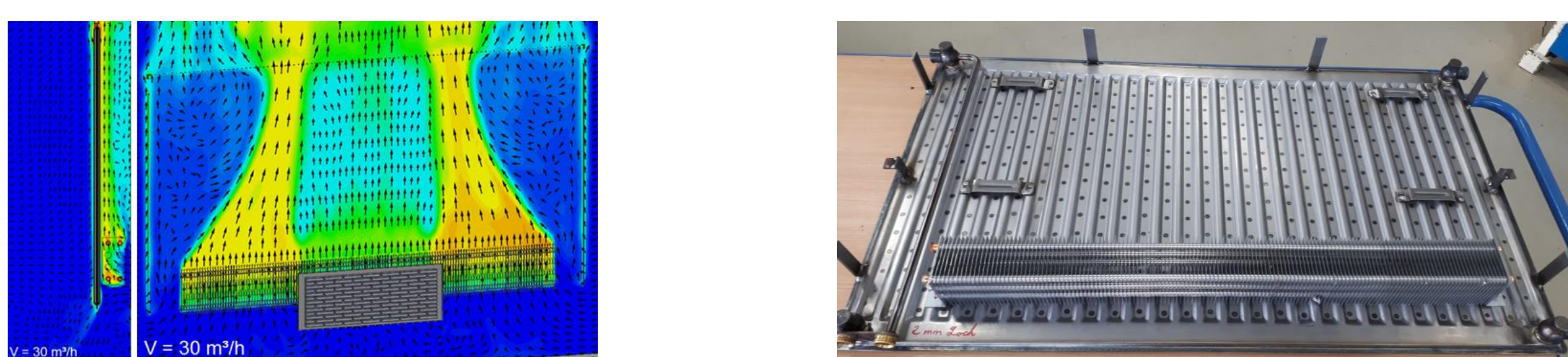
Temperaturverlauf im Heizkörpermodell mit Zuluft (links); Funktionsmuster, Rückseite der Heizfläche (rechts)

KERMI GmbH entwickelt angepasste Niedertemperatur-Heizflächen, für die Heizung, Kühlung und Belüftung von Räumen, welche sich optimal mit Lüftungsanlagen kombinieren lassen.