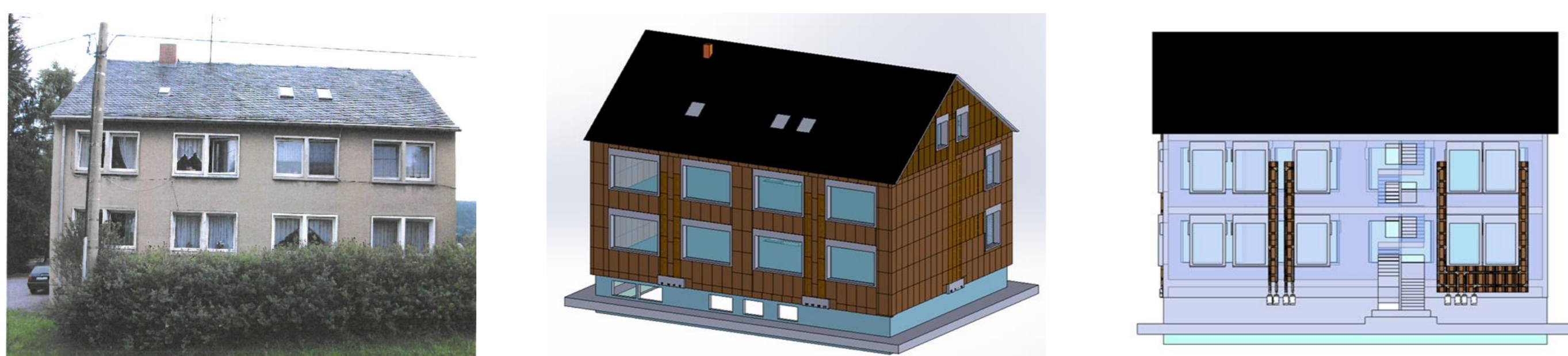
Bestandsgebäude, Dämmsystem, Verlegeschema Lüftung (v.l.n.r.)